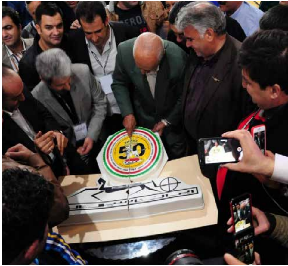
Text und Fotos Ramin Salehkhov/FIVA