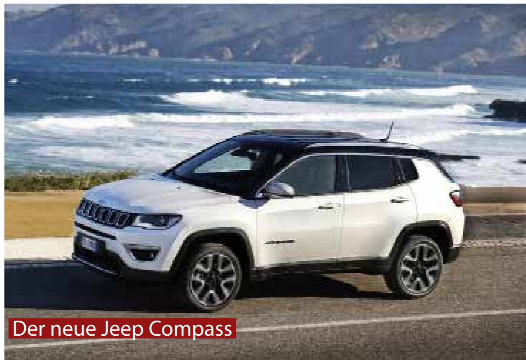
Der neue Jeep Compass

Die Brunold Automobile GmbH bietet eine hochwertige Auswahl an Jeep® und Alfa Romeo Modellen. Das Produktportfolio der Marken Alfa Romeo und Jeep® reicht dabei vom sportlichen Stadtgefährt über dynamische SUVs bis hin zum robusten Geländewagen und deckt damit die vielseitigen Kundenwünsche in puncto Design, Sportlichkeit und Belastbarkeit ab. Erleben Sie den neuen Jeep Compass bei einer Probefahrt bei Brunold Automobile. Der Jeep® Compass kombiniert nutzerfreundliche Technologien und eine Vielfalt an Fahrer-Assistenzsystemen mit legendären Jeep-Geländefähigkeiten sowie einem einzigartigen und modernes Design.