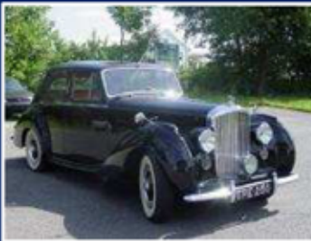
Bentley R-Type Limousine Bj: 1953 4.566 ccm 6 Zylinder Reihe 111 kW/150 PS