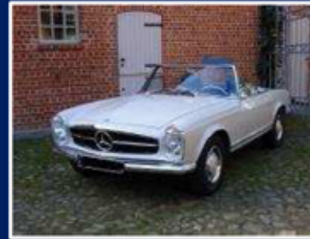
Mercedes-Benz 230 SL (W 113) Roadster

Bj: 1966 2.306 ccm 6 Zylinder Reihe 110 kW/150 PS Preis auf Anfrage