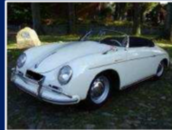
Porsche 356 A 1600 Super Speedster

Bj: 1957 1.897 ccm 4 Zylinder Reihe 77 kW/105 PS Preis auf Anfrage