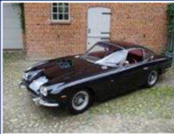
Lamborghini 400 GT Coupé 2+2 Bj: 1967 3.992 ccm V 12 235 kW/320 PS

Bj: 1956 1.582 ccm 4 Zylinder Boxer 56 kW/75 PS Preis auf Anfrage