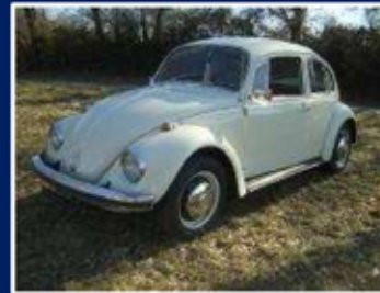
VW 1500 "Käfer" Limousine Bj: 1968