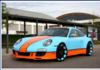
Porsche 997 Targa 4S „Gulf“