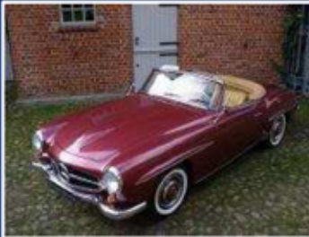
Mercedes-Benz 190 SL (W 121) Roadster

Bj: 1966 2.306 ccm 6 Zylinder Reihe 110 kW/150 PS Preis auf Anfrage