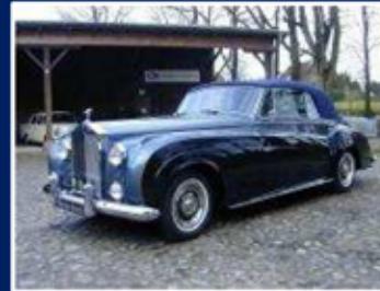
Rolls-Royce Silver Cloud II Bj: 1961

Cabriolet H.J. Mulliner 6.230 ccm V 8 148 KW/200 PS