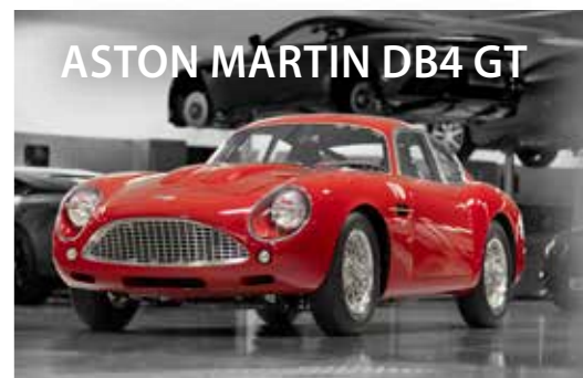
ASTON MARTIN DB4 GT