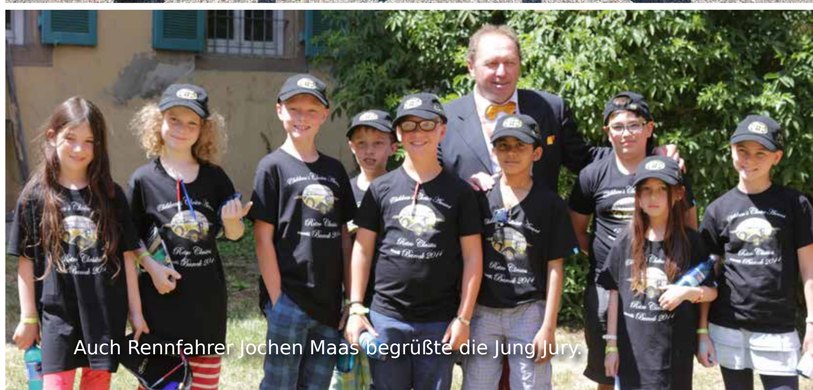
Auch Rennfahrer Jochen Maas begrüßte die Jung Jury.