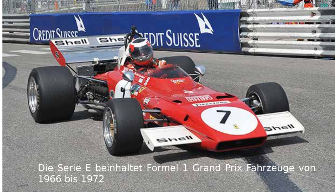
Die Serie E beinhaltet Formel 1 Grand Prix Fahrzeuge von 1966 bis 1972