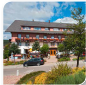
Hotel Wocher's Sternen Schluchsee