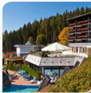
Hotel Vierjahreszeiten Schluchsee