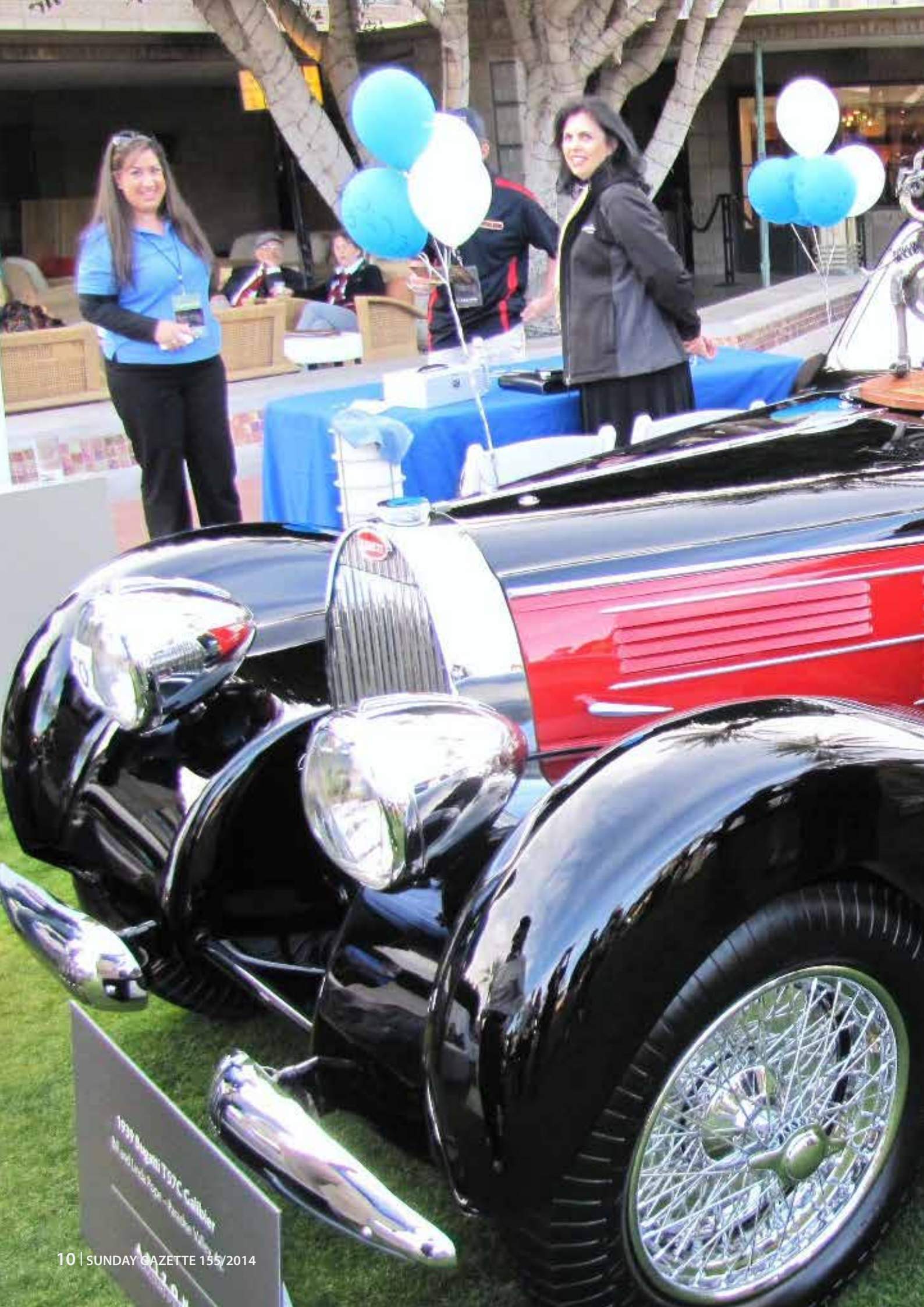
1939 Packard Sedan www.parklane.com