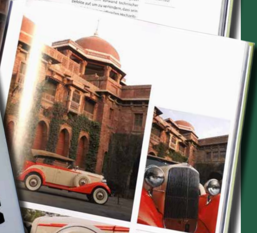
Das Schloss des Maharaja von Kashmir in Srinagar, das der Maharaja von Kashmir im Jahr 1930 gekauft hat.