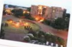
Das Schloss des Maharaja von Kashmir in Srinagar, das der Maharaja von Kashmir im Jahr 1930 gekauft hat.

Die Geschichte dieses Delahaye 1930er Modells beginnt mit dem Maharaja von Kashmir, der es im Jahr 1930 gekauft hat. Der Maharaja von Kashmir hat das Delahaye 1930er Modell gekauft. Sawal Man Singh II. war ein charmanter Zügelmann und ehemaliger Polospieler. Berühmt geworden war er aber vor allem durch seine Hochzeit mit der legendären Schönheit Ganga Devi aus dem Hause der Maharajas von Kashmir. Der Maharaja von Kashmir hat das Delahaye 1930er Modell gekauft. Sawal Man Singh II. war ein charmanter Zügelmann und ehemaliger Polospieler. Berühmt geworden war er aber vor allem durch seine Hochzeit mit der legendären Schönheit Ganga Devi aus dem Hause der Maharajas von Kashmir.