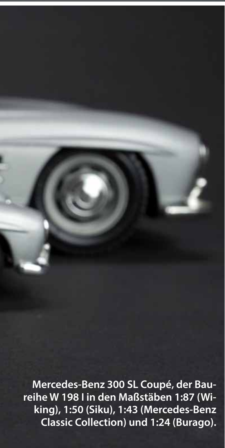
Mercedes-Benz 300 SL Coupé, der Baureihe W 198 I in den Maßstäben 1:87 (Wiking), 1:50 (Siku), 1:43 (Mercedes-Benz Classic Collection) und 1:24 (Burago).

USA, im August die Höchstmarken des Jahres für Preise von seltenen Klassikern aller Marken verzeichnet wurden – wie auch im HAGI Top Index enthalten – kam es im September offenbar zu einem leichten Überangebot von Fahrzeugen. Bei Mercedes-Benz war das etwa bei den Baureihen W 116, W 121, W 128, W 186 und W 198 zu beobachten. Bereits im Herbst positionieren sich aber viele Sammler mit ihrem Portfolio für die Saison des nächsten Jahres. Die Sammler auf der Südhalbkugel statten sich gleichzeitig für die dortige Saison aus. Auch aus diesen Gründen glied sich der MBCI im Oktober wieder aus und überstieg seinen eigenen Höchstwert vom Juli 2013.