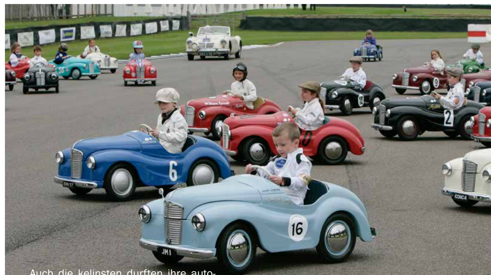
Auch die kleinsten durften ihre automobile Rennleidenschaft ausleben ...