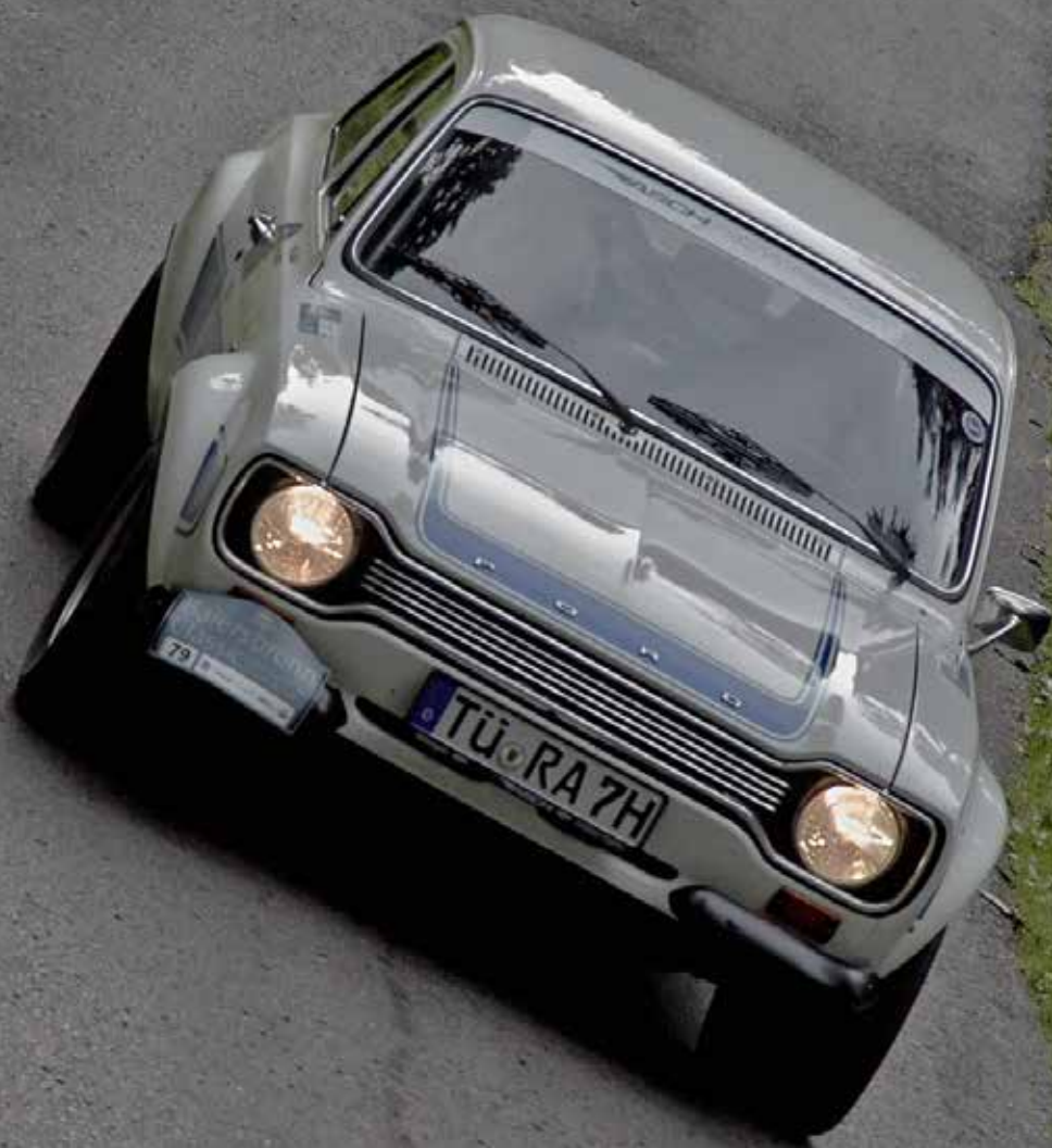
Auch Motorsportlerin Ellen Lohr nahm in einem Ford „Hundeknochen“ teil.