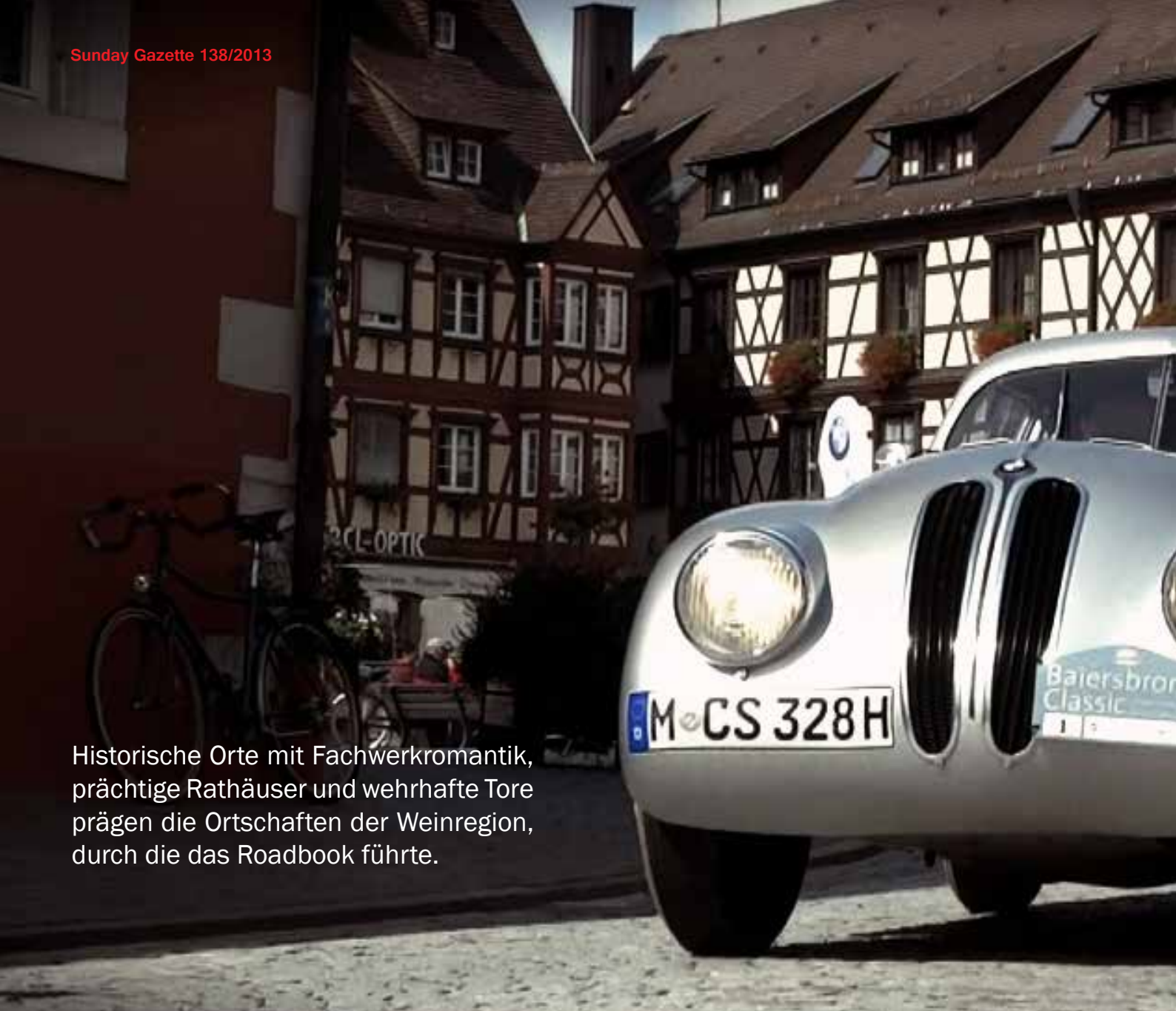
Historische Orte mit Fachwerkmantik, prächtige Rathäuser und wehrhafte Tore prägen die Ortschaften der Weinregion, durch die das Roadbook führte.