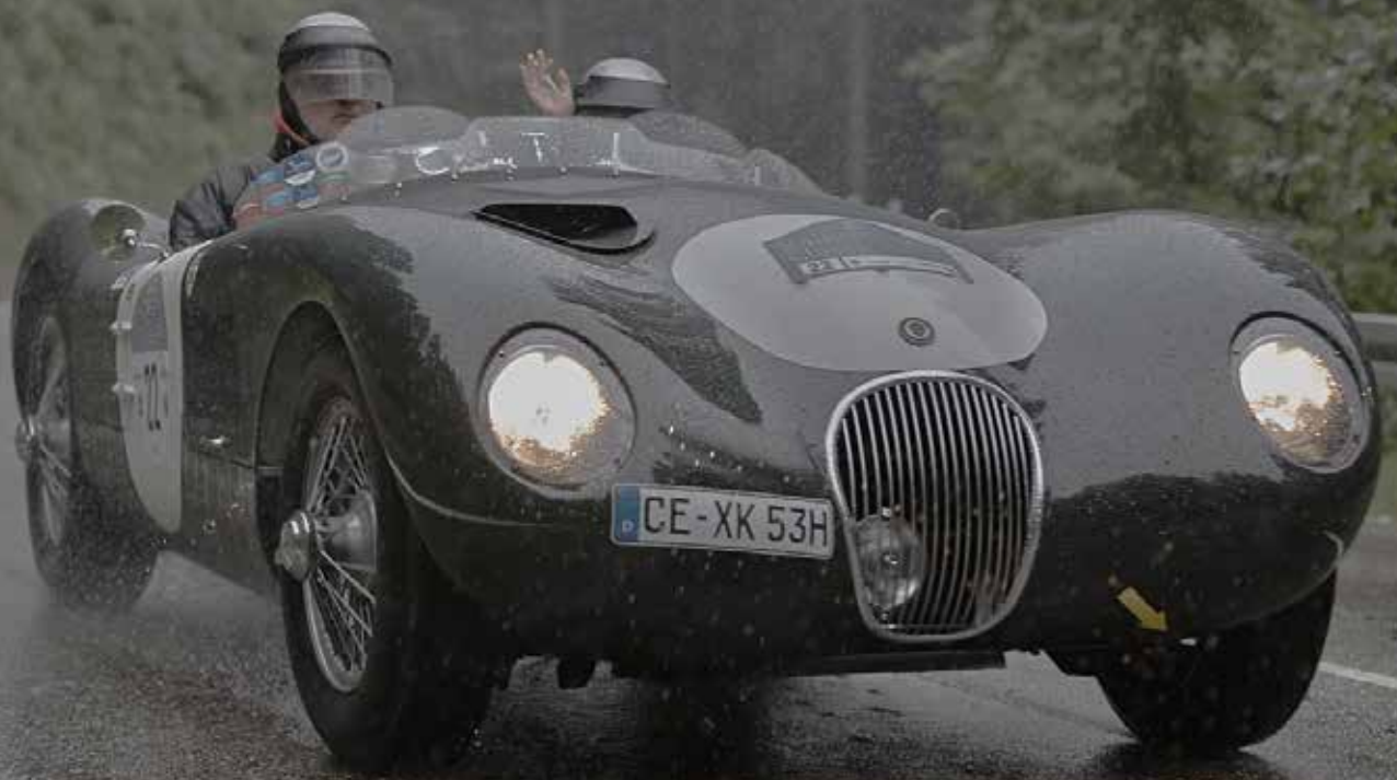
Der teilweise starke Regen forderte einiges von Mann und Maschine ...