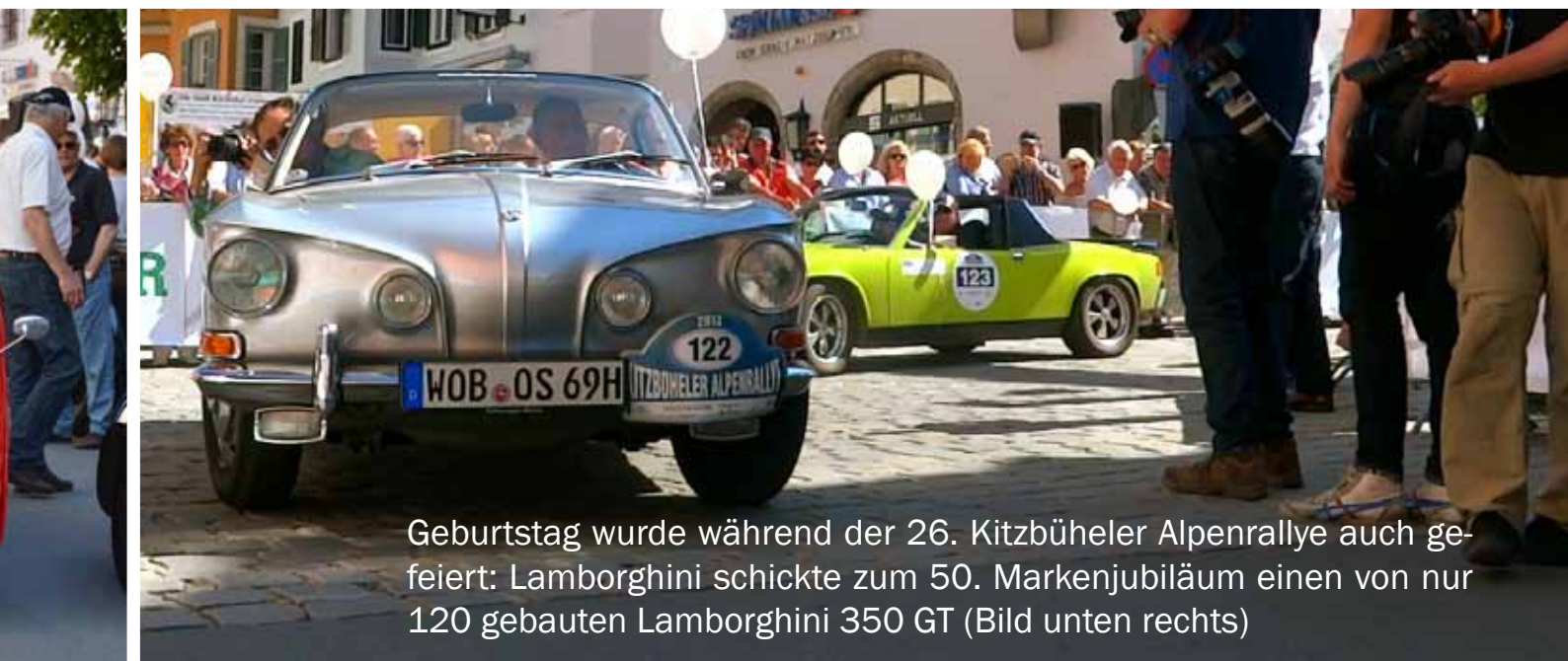
Geburtstag wurde während der 26. Kitzbüheler Alpenrallye auch gefeiert: Lamborghini schickte zum 50. Markenjubiläum einen von nur 120 gebauten Lamborghini 350 GT (Bild unten rechts)